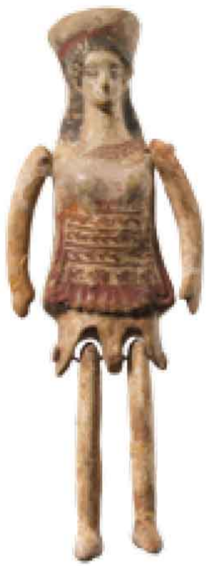
عروسک سفالین مفصل‌دار، مربوط به یونان باستان، سده پنجم پیش از میلاد، ارتفاع ۱۲ سانتی‌متر، موزه متروپولیتن نیویورک، آمریکا

از سوی دیگر، ساخت عروسک‌های امروزی یا عروسک‌هایی که در آن‌ها از مواد صنعتی مدرن استفاده شده است، برای نخستین بار در قرن پانزدهم میلادی و در کشور آلمان اتفاق می‌افتد. در قرن بیستم، تولید انبوه عروسک با هدف‌های تجاری رونق می‌گیرد و عروسک‌ها با شکل و شمایلی تجاری به بازار عرضه می‌شوند، اما عرضه عروسک‌های تجاری هیچ‌گاه سبب نمی‌شود که تولید انواع محلی و خانگی آن به فراموشی سپرده شود؛ به‌طوری‌که در دهه‌های اخیر، در بازار، مراکز فرهنگی و هنری و فروشگاه‌های صنایع دستی، انواع بسیار متفاوتی از عروسک به چشم می‌خورد که برخی از آن‌ها هیچ نمونه مشابهی ندارند. همین گوناگونی کم‌نظیر عروسک‌ها هم سبب شده است که امکان تقسیم‌بندی دقیق آن‌ها وجود نداشته باشد. با این حال، عروسک‌ها را می‌توان براساس شخصیت انسانی یا حیوانی، شکل ظاهری، مواد مورد استفاده در ساخت، و نوع کاربرد (اسباب‌بازی یا نمایش و آموزش) آن‌ها دسته‌بندی کرد و حتی می‌توان به آن‌ها نام‌هایی دلخواه و شخصی بخشید. مهم این است که نام‌گذاری، نزدیک به ویژگی‌های ظاهری و مواد یا موارد استفاده آن‌ها باشد.