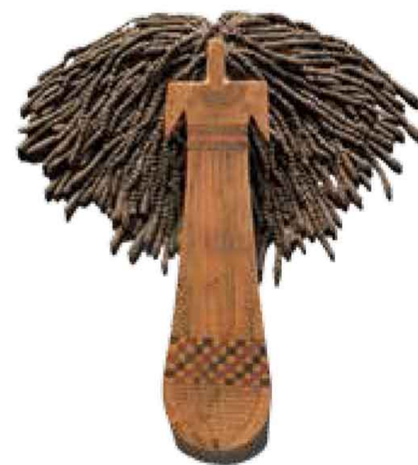
عروسکی از جنس چوب، گل، نخ کنفی و رنگ طبیعی، مربوط به مصر باستان (۲۰۳۰-۱۸۰۲ پیش از میلاد)، موزه متروپولیتن نیویورک، آمریکا